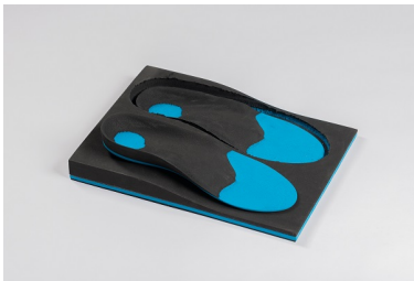
EVA sandwich: noir 70° - bleu 25° - noir 50° Bloc dénivelé sans duralux Abréviation: NBN