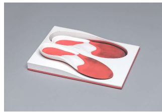
EVA sandwich: noir 70° - rouge 25° - blanc 40° Bloc dénivelé sans duralux Abréviation: NRB