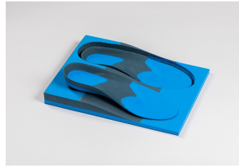
EVA sandwich: 30° En dessous - 40°dessus Bloc dénivelé avec ou sans duralux Abréviation: S, S+