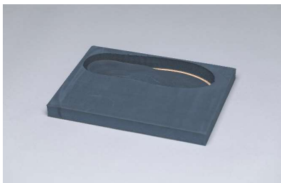
EVA bleu 60° Bloc complet avec ou sans dualux Abréviation: 60, 60+