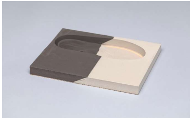
EVA Combi: brun 50° - beige 30° Bloc complet avec duralux Abréviation: BI 50/30, BI+ 50/30