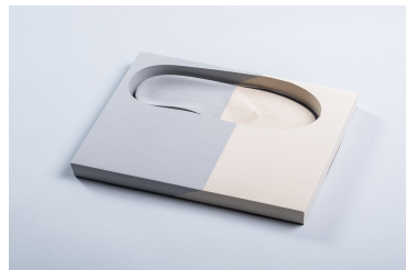
EVA Combi: gris 40° - tierra 30° Bloc complet sans ou avec duralux Abréviation: BI 40/30, BI 40/30+