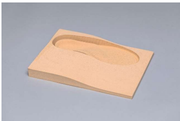
EVA liège 45° Bloc dénivelé avec duralux Abréviation: L+