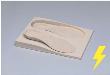
EVA couleur de chair 25°, beige 30° Bloc dénivelé avec ou sans duralux Aussi en antistatique noir, biseauté sans duralux Abréviation: 25+, 30, 30+, 30 ESD