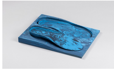
EVA bleu marbre 50° Bloc dénivelé avec ou sans duralux Abréviation : MB, MB+