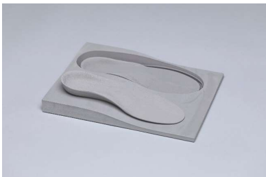
EVA gris claire 40° Bloc dénivelé avec ou sans duralux Bloc complet sans duralux gris ou noir Abréviation: 40, 40+, 40noir