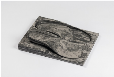
EVA noir marbre 40° Bloc dénivelé avec ou sans duralux Abréviation : MN, MN+