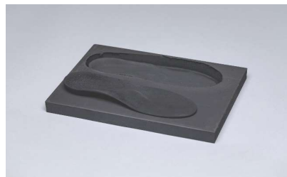
EVA noir 70° Bloc complet sans duralux Abréviation: 70