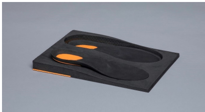
EVA noir 50° avec amortissement au talon de 20° Pour traitement de 'Fasciite 'par.ex. Bloc dénivelé avec duralux Abréviation : AT+